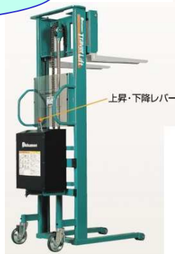
トラバーリフター