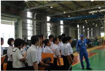
地元中学校の工場見学風景