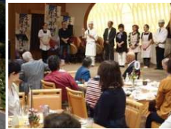
地元との交流 地産地消食事会の様子