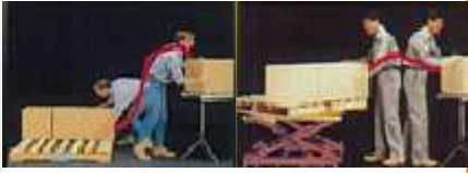
床直置きとレベラー使用の動き比較