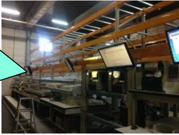
前面側 (ケース→出庫)

上の空間にはパレットを保管し、下の空間にフローティングラックを入れてピッキングを行えます! さらに作業台とモニター、コンベヤを組み合わせて検品・梱包ライン