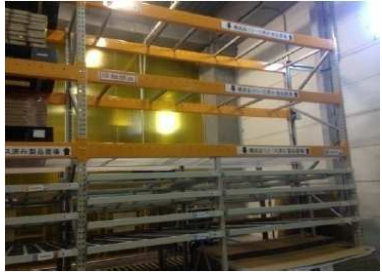
背面側 (パレット→入出庫) (ケース→入庫)