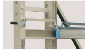
ワンタッチロックアップ機構

800mmのロングストロックですので、スライドテーブル全体を引出すことができ、収納物を楽に出し入れできます。