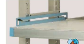
多段引き出し防止機構