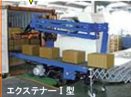
エクステナー I 型