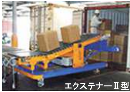
エクステナー II 型