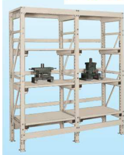
小・中型金型専用